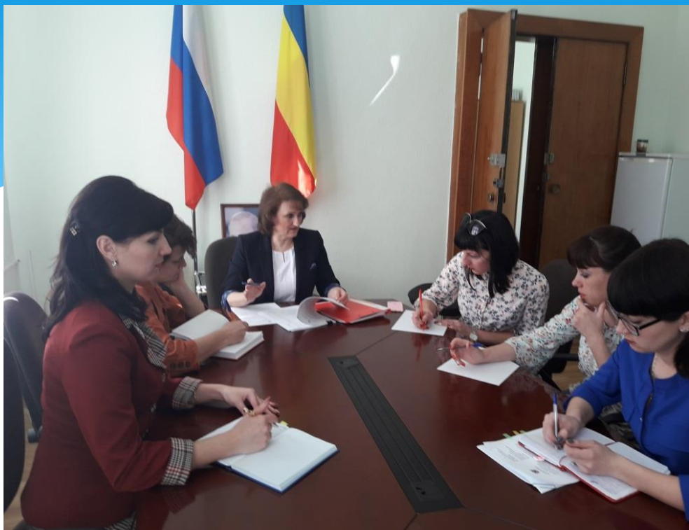
Семинар с работниками организаций – источниками комплектования архивного сектора Администрации Цимлянского района. Апрель 2018 года