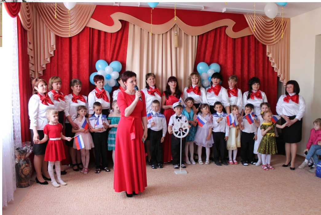
Педагогический состав с воспитанниками детского сада «Алые паруса» г. Цимлянск 30 апреля 2015 года