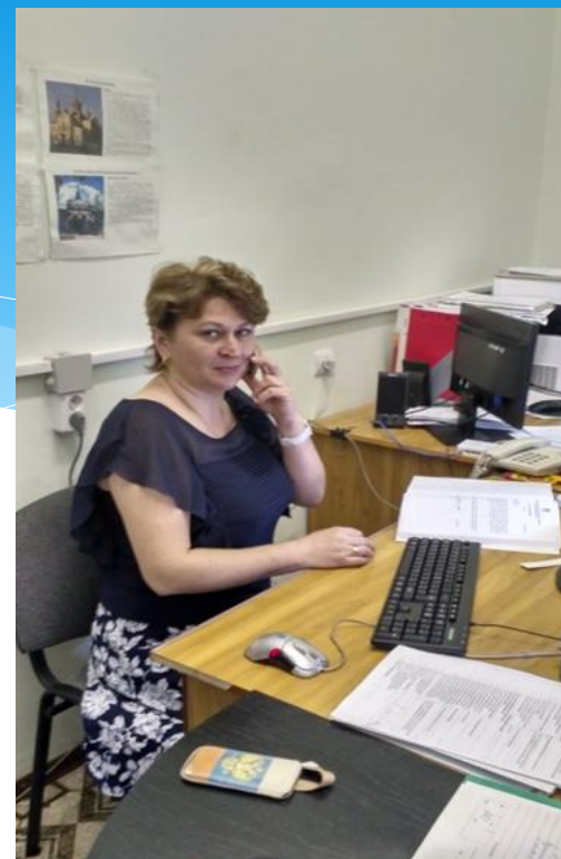
Прием граждан ведет старший инспектор архивного сектора Администрации Цимлянского района